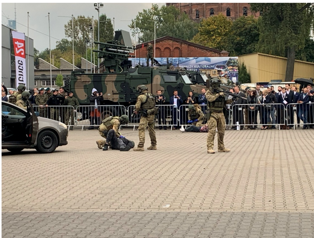
Pokaz działań BOA KGP i Służb Ratowniczych w symulacji próby przejęcia konwoju o dużej wartości.

Po zakończeniu uroczystości otwarcia, na uczestników dwudniowego wydarzenia czekało przygotowanych ponad trzydzieści paneli obejmujących m.in. sfery tematyczne takie jak: bezpieczeństwo narodowe, współpraca regionalna, rozwój przemysłu zbrojeniowego, udział technologii w warunkach bojowych, medycyna pola walki, czy działania wschodniej flanki NATO. Oprócz paneli tematycznych, przygotowano także pokaz działań Centralnego Pododdziału Kontrterrorystycznego Policji „BOA” oraz służb ratowniczych.